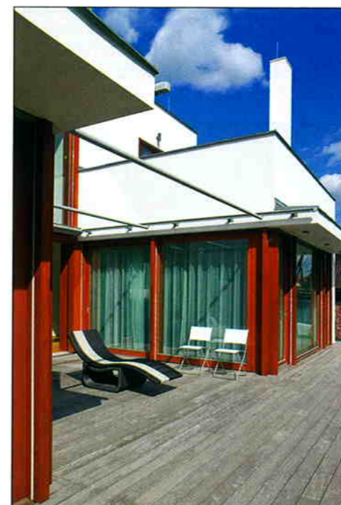
Příchod je krytý lehkou pergolou.