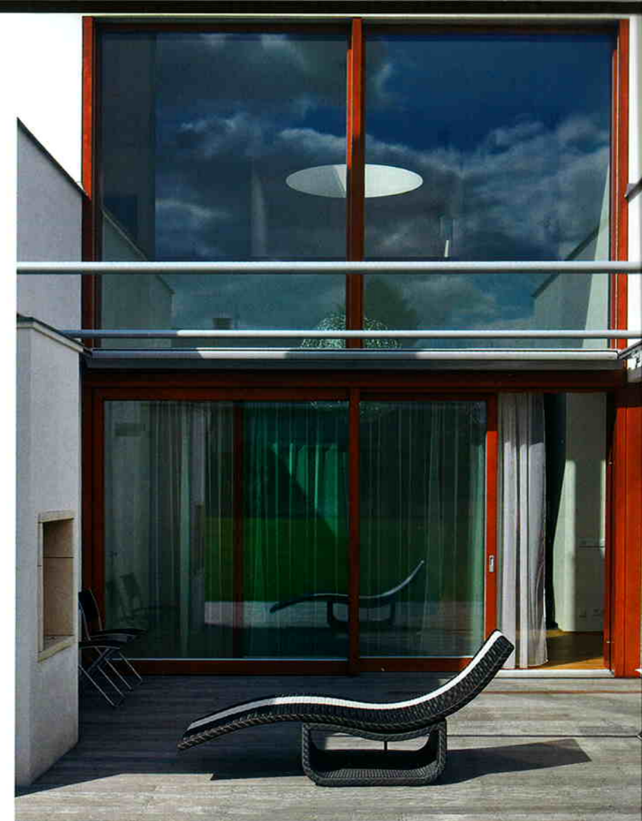
Patio sevřené křivočarými

Vytápění: tepelné čerpadlo, podlahové topení