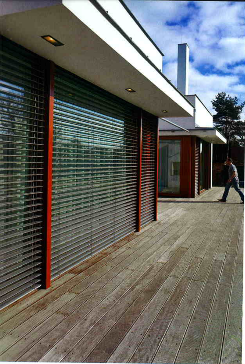
Směrem do zahrady vyběhá dřevěný rošt.