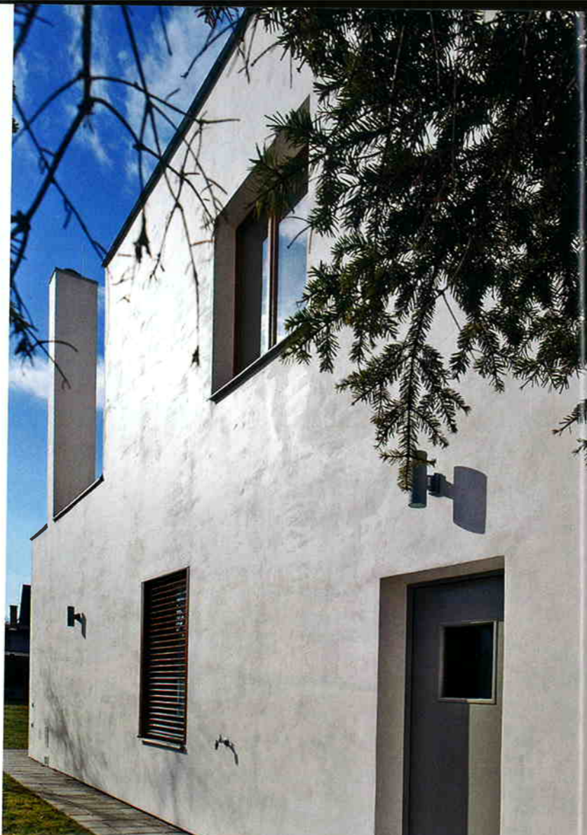
Vymývaná omítka BASF, hlazená ocelovým hladítkem, má hedvábně sametový lesk.